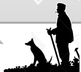
Brebis gardées dans les vignes

« C'est dur physiquement, oui. Avant-hier, je les ai vermifugées, j'ai mal au dos. Travail physique qui t'use, c'est certain. »